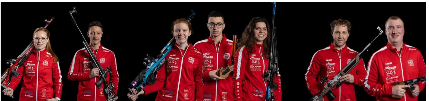
Schweizer Schützinnen und Schützen an den Olympischen Spielen in Paris