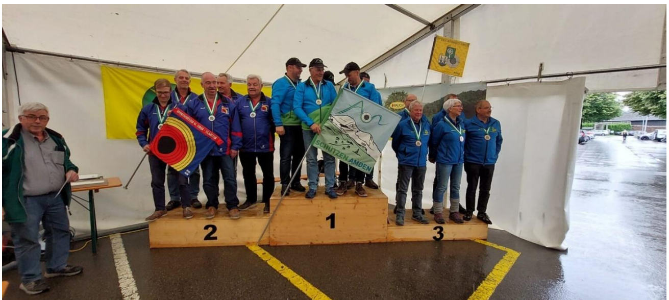
v.l. St. Gallen St. Fiden Sport, Amden Schützen, Eggesriet-Grub SV