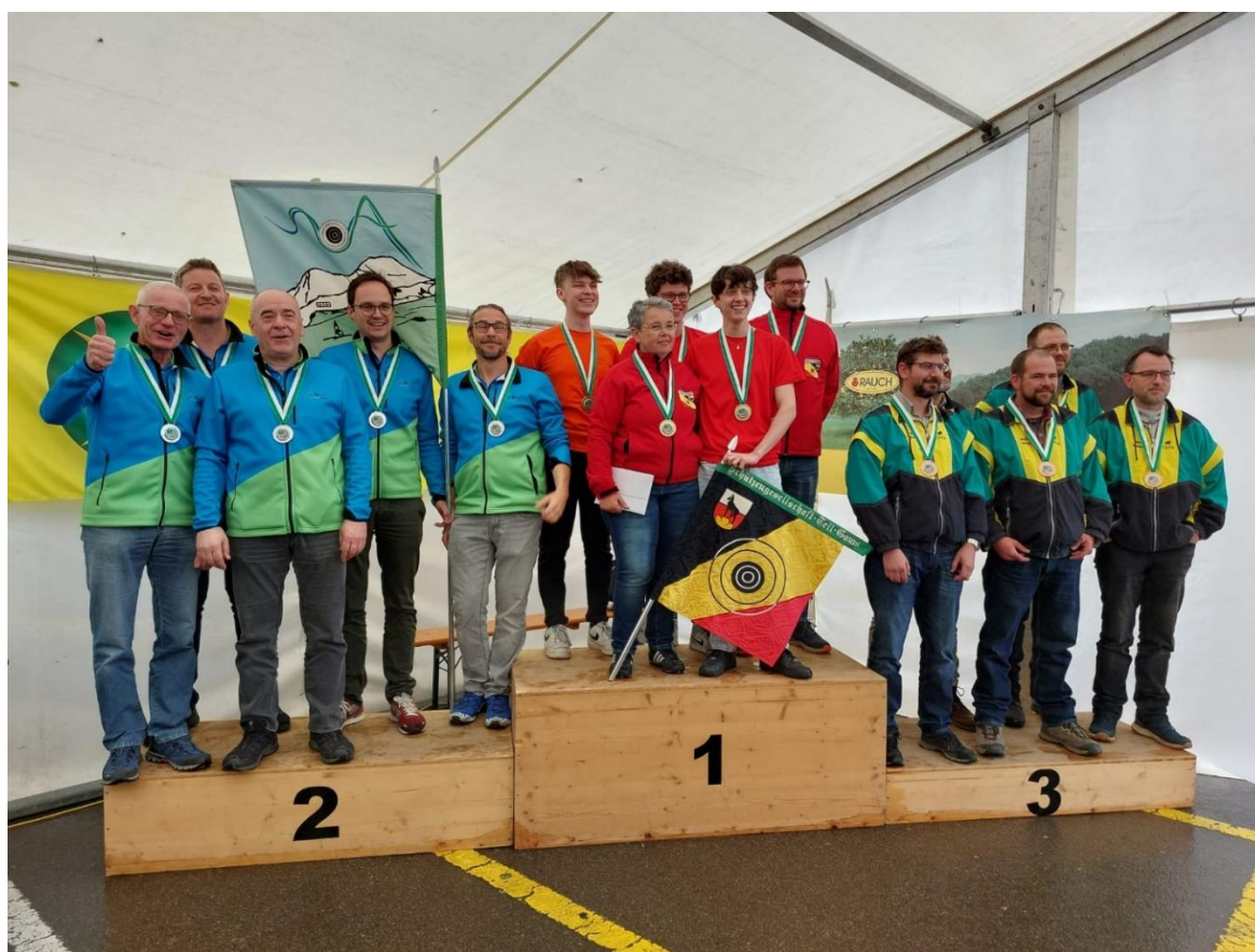
v.l. Amden Schützen, Gams SG Tell, Tannen MSV