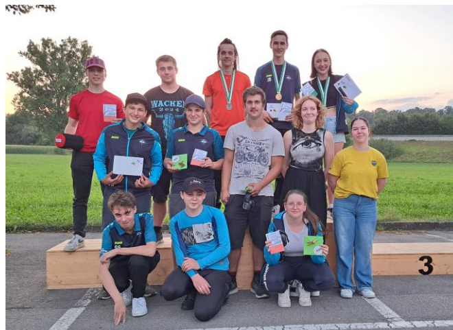
Kantonaler Matchtag, Nachwuchs, 40 Schuss Stgw 90