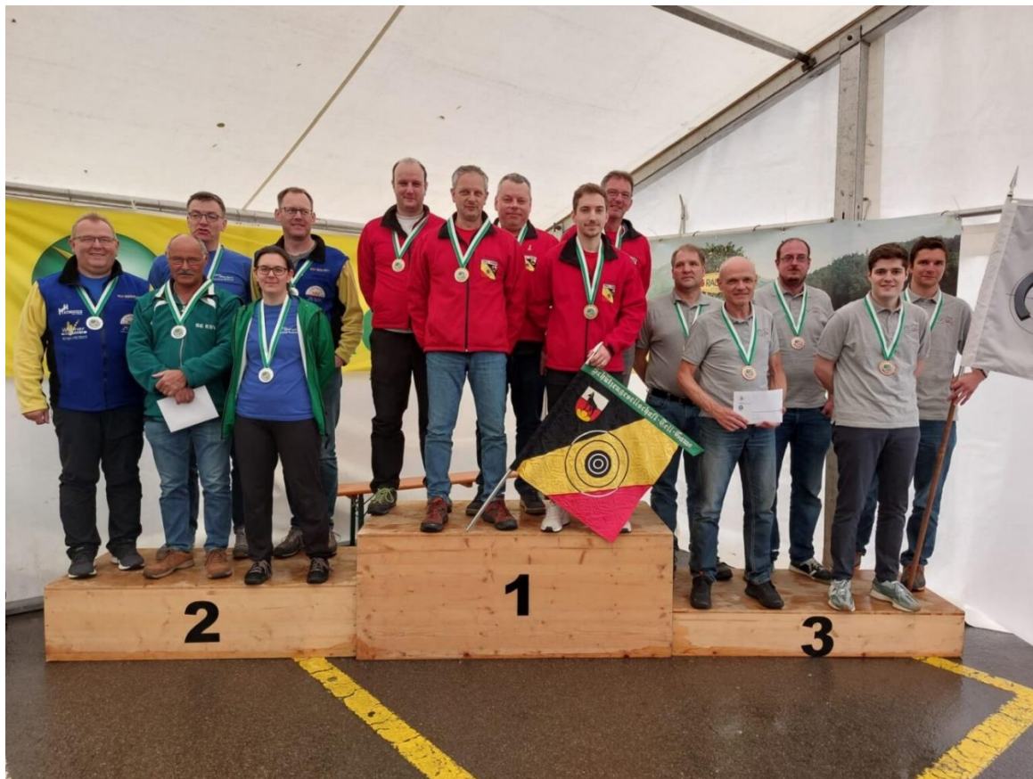
v.l. Mosnang-Mühlrüti Sport, Gams SG Tell, Sargans SV