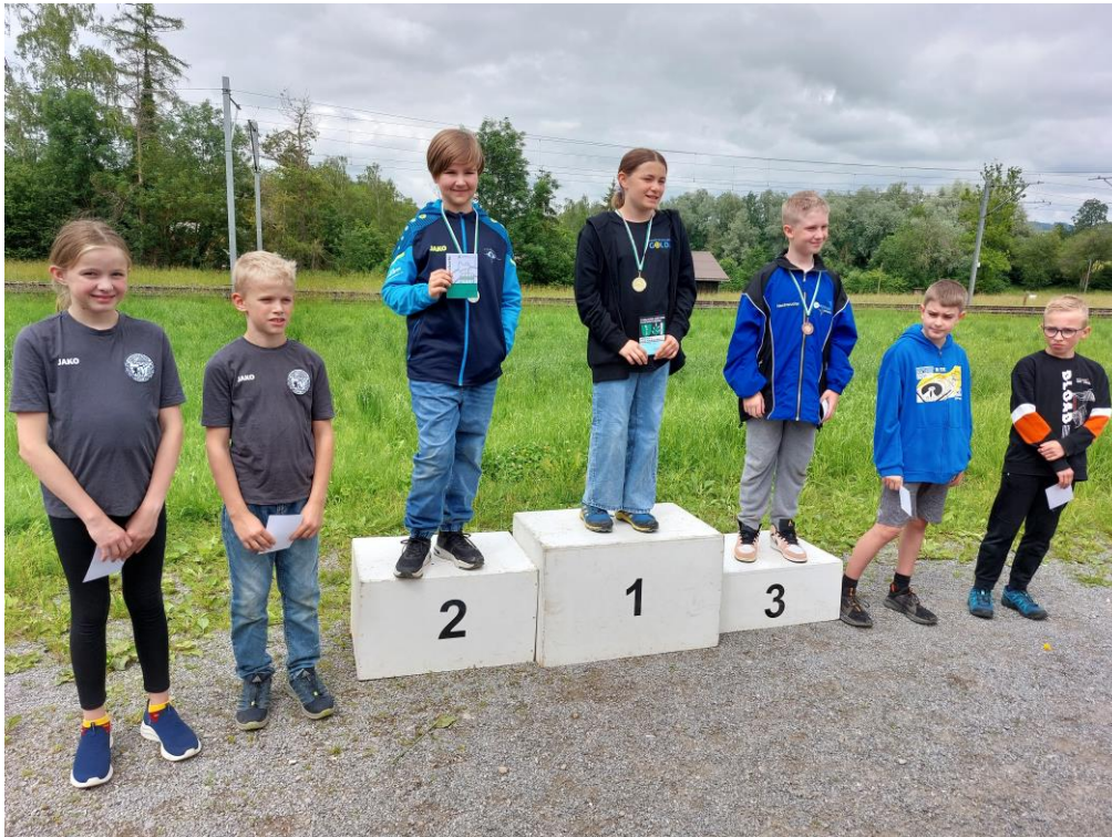
Die Jugend, unsere Zukunft